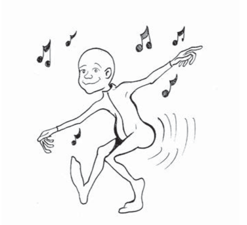
Cazador de almas 4 ( El bailarín)