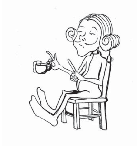
Cazador de almas 3 ( El aristócrata )