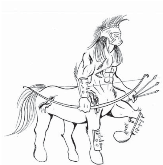
Ergus el centauro