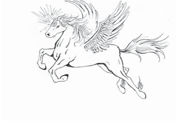
Un caballo Talcel de la dimensión de Talcels (personaje del próximo libro)