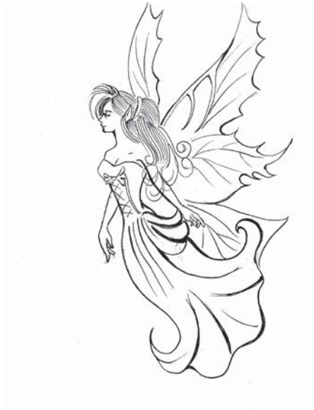
Lía el hada