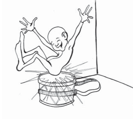
Cazador de almas 2 ( El del tambor)