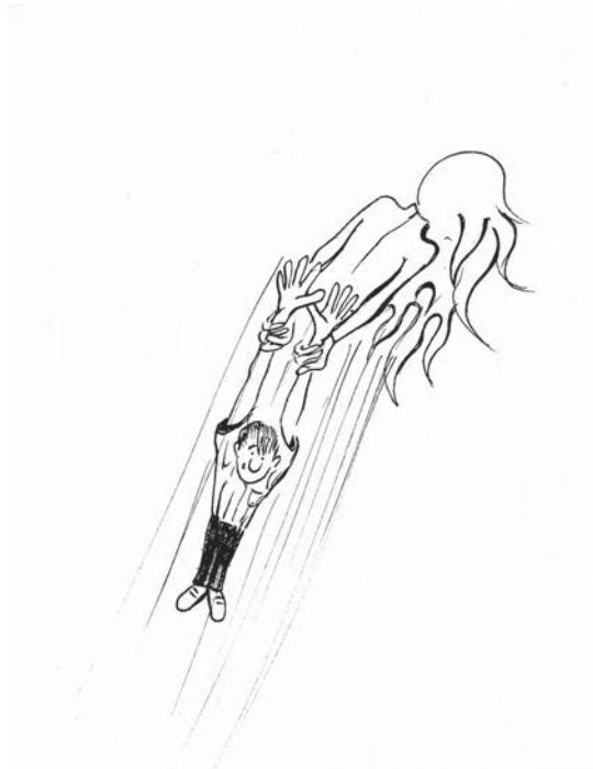
Un cazador de almas en acción