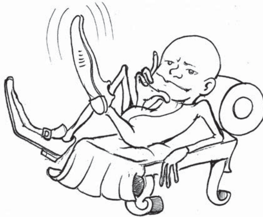
Cazador de alma 1 (El sabio )