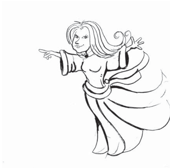
Zia la maga ( un personaje de mi próximo libro)