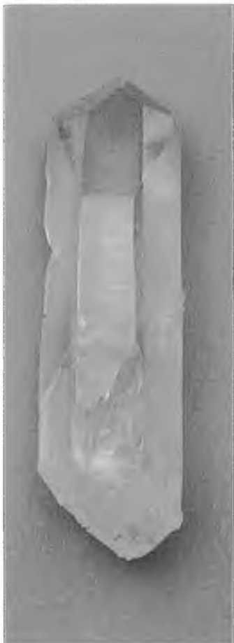
Cuarzo de un punto