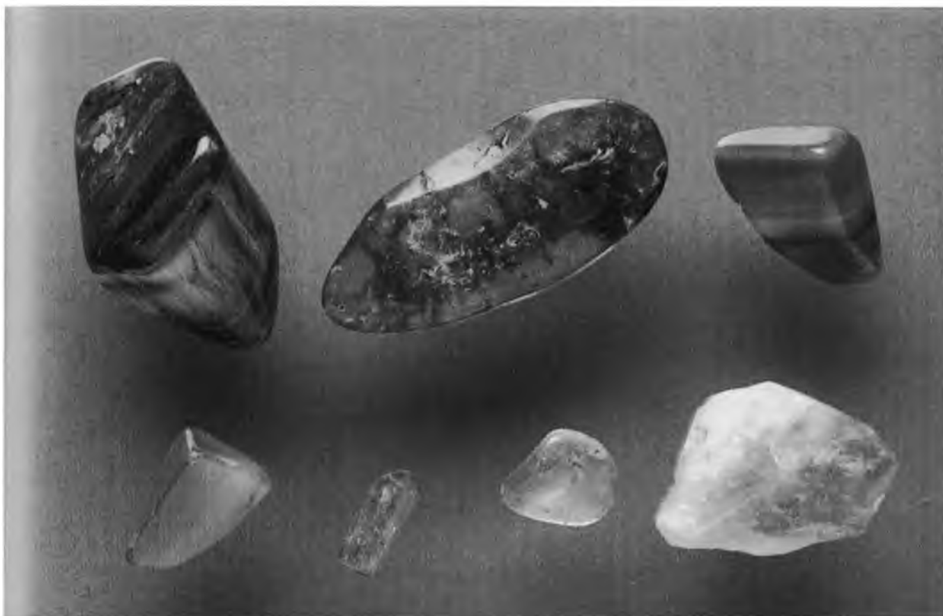
Arriba: Ojo de tigre, Ámbar, Ágata anaranjada Abajo: Cornalina, Topacio, Berilo, Citrino