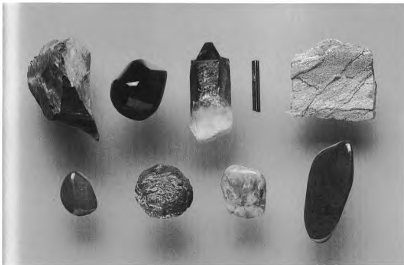
Arriba: Azabache, Obsidiana, Cuarzo ahumado, Turmalina negra, Hematita Abajo: Jaspe rojo, Granate, Rubí, Piedra de sangre