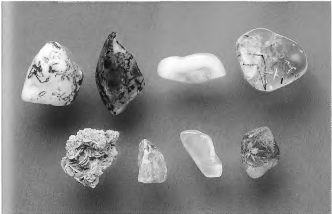
Arriba: Ágata de árbol, Ágata musgosa, Calcedonia blanca, Cuarzo turmalado Abajo: Selenita, Ópalo, Piedra de luna, Cuarzo rutilado