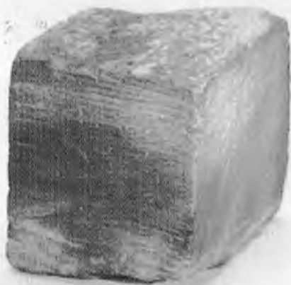
Piedra de pipa