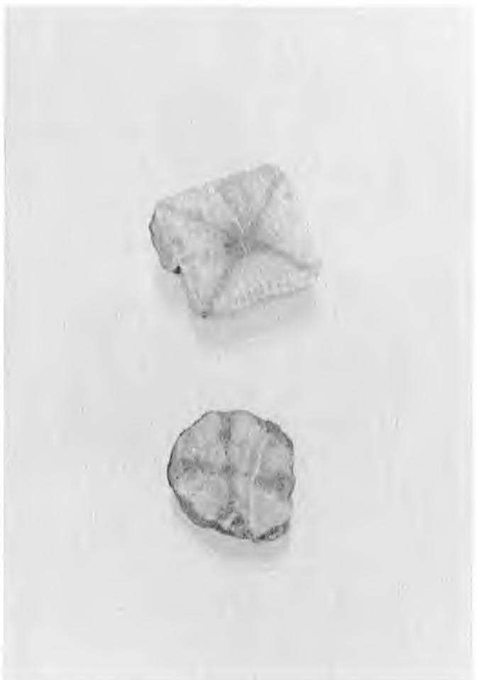
Piedras de cruz